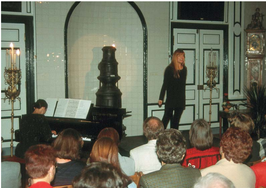
Seit Jahrhunderten ist der Fürstensaal im Schloß Schauplatz kultureller Veranstaltungen wie hier im Rahmen der seit 1954 veranstalteten Schloßspiele bei einem Chanson-Abend mit Katja Ebstein am 29. Juni 1996.