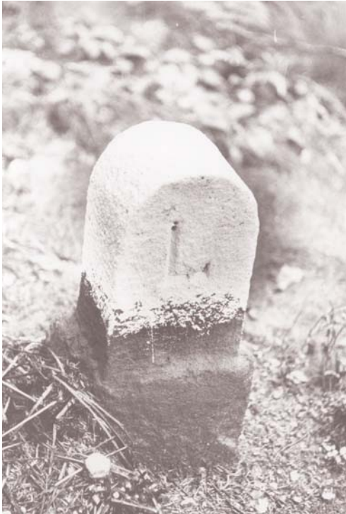
Grenzstein mit dem auf die Grafschaft Limburg zurückgehenden markanten „L“.

für die aktuelle und künftige Entwicklung auf und um Schloß Hohenlimburg. 2)