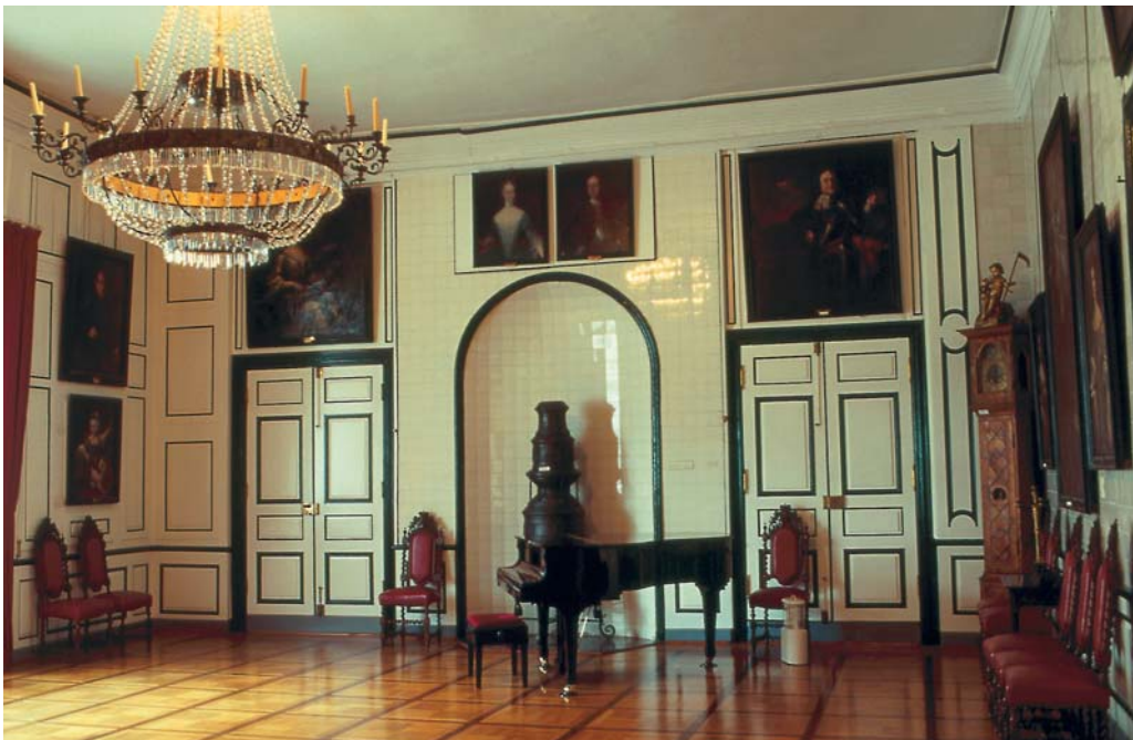
In der Mitte des 18. Jahrhunderts entstand die heutige Gestalt des neuen Palasgebäudes von Schloß Hohenlimburg mit dem spätbarocken Festsaal. Weiße Delfter Kacheln an den Wänden machen den Saal zu einer architektonischen Rarität.

Es versteht sich von selbst, daß die Medien am Ort und in der Region bis hin zum Fernsehen längst in verstärktem Maße auf die breitgestreute Palette an Aktivitäten aufmerksam geworden sind. Das könnte dabei helfen, auch den zur Fußballweltmeisterschaft 2006 in Deutschland erwarteten Tourismus auf die einzige erhaltene Höhenburg Westfalens zu locken. Engagierte – überwiegend weibliche – Museumsführer geben dem Besucher hier Einblicke in die Geschichte des Schlosses, des Fürstenhauses und der Region. Im Kaltwalzmuseum