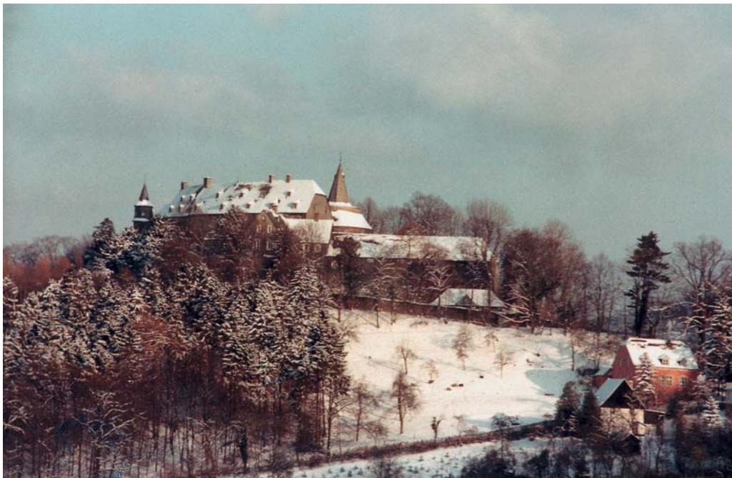
Der Winter hüllt Schloß Hohenlimburg in sein weißes Kleid.

Der Bericht „Zielkonzeption 2005 und Übergangmanagement 2003“ der Krefelder Unternehmensberatung CULTURPLAN (ICG Consulting Deutschland AG) trägt das Datum 17. November 2002. Darin heißt es, das Unternehmen sei im November 2001 3) beauftragt worden, in einem Gutachten Aussagen zum Standort Schloß Hohenlimburg, zur Entwicklungsperspektive und Profilierung und zu den Zielgruppenpotentialen zu treffen. Nach Vorlage dieses Gutachtens im