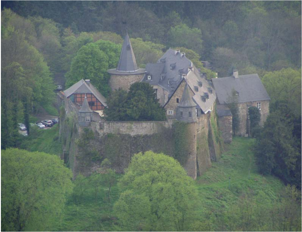
Diese ungewöhnliche Gesamtansicht von Schloß Hohenlimburg eröffnet sich dem, der in der Gondel eines Ballons an dem Bauwerk vorbeischwebt (Blick von Nordost).

Foto: Friedhelm Siegismund (30. April 2005)