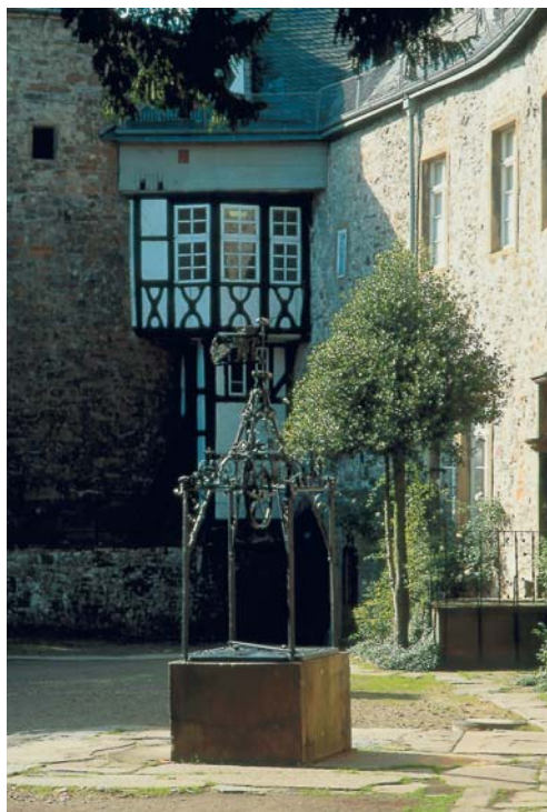
Der obere Hof des Schlosses mit dem Fachwerk-Erker und dem Ziehbrunnen aus dem 18. Jahrhundert. Die Wetterfahne auf dem schmiedeeisernen Aufsatz zeigt die Initialen des Grafen Moritz Casimir I. und die Zahl 1749.

Darüber hinaus befaßt sich das Gutachten mit möglichen Konstruktionen einer Trägerschaft und damit zusammenhängenden Modellen für ein Betreiberkonzept. Favorisiert wird eine gemeinnützige GmbH , die inzwischen auch gegründet worden ist, worauf in der Chronologie dieser Darstellung eingegangen sein wird.