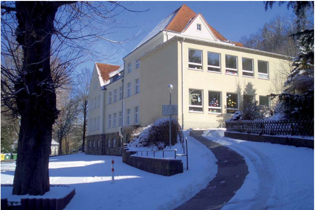
Katholische Grundschule Wesselbach