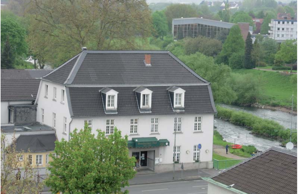
Bentheimer Hof, gesehen vom Turm des Hohenlimburger Rathauses. Erbaut wurde der „Bentheimer“ von Gastwirt Johann Peter Braß Ende des 18. Jahrhunderts, vermutlich 1796/97.