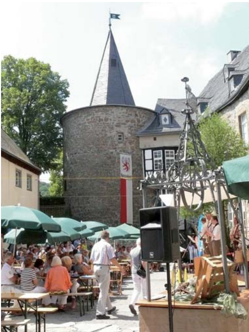
Jazzfrühschoppen mit Rod Mason's Hot Five Foto: Achim Koordt, 17. Juli 2011

Einen begeisternden Abschluss finden die 57. Hohenlimburger Schloßspiele mit Rod Mason's Hot Five beim Jazzfrühschoppen. Über 5000 Besucher haben das Angebot der 4wöchigen Spielzeit erlebt.