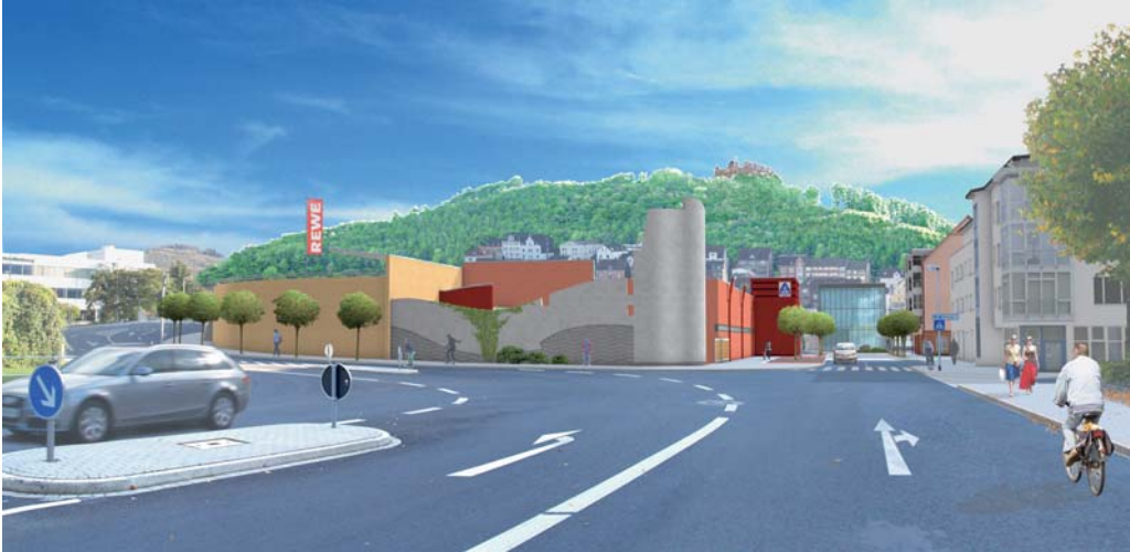
Plan Neugestaltung nach Abriss des Parkhauses und Bahnhofes Skizze: Projektentwickler Domansky – Kissing (Westfalenpost, 12. Juni 2010)