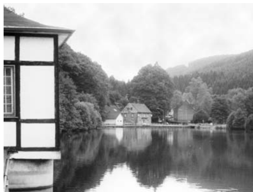
Blick auf den damaligen Koenigsee mit Pumpenhäuschen (li.) und Lahmen Hasen im Hintergrund im September 1984.

Vor fünf Jahren wurde durch MdL Wolfgang Jörg (SPD) die überparteiliche Obernahmer Konferenz ins Leben gerufen. Die Stetigkeit wird belohnt: Im August 2010 wird mit dem Abriss von Werk IV und der Hochbehälter begonnen. Wolfgang Jörg wünscht sich zur späteren Nutzung die Ansiedlung von kleinteiligem Gewerbe und Gewerbetreibenden. Das Gebiet soll zudem eine Wohnansiedlung ermöglichen. Und das alte Pumpenhäuschen mit seinem Fachwerkcharakter am ehemaligen Koenigsee könnte einen Ausstellungsraum für Industriegeschichte beherbergen . . .