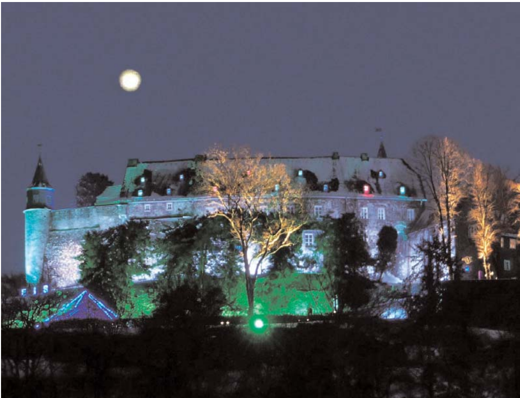
Illumination „Eispalast“ Schloß Hohenlimburg