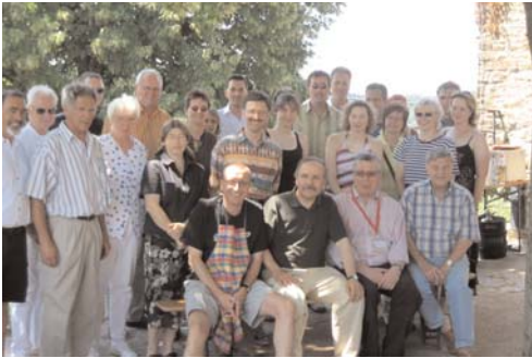
Helfertreffen unter der Linde im neu errichteten Kräutergarten am Bergfried am 2. Juli 2006

Bürgerschaftliches Engagement für Schloß Hohenlimburg: Nach Fertigstellung der drei Gartenprojekte Weinberg, Streuobstwiese und Kräutergarten laden Heimat- und Wesselbachverein tatkräftige Helfer ein. Über 30 Aktivisten folgen der sonntäglichen Einladung – und werden mit Kräutergerichten und kühlen Getränken verwöhnt.